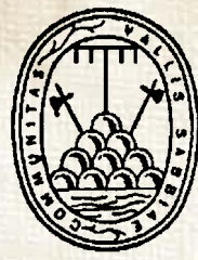
Comunità Montana di Valle Sabbia