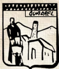
Associazione Borgo del Quadrel