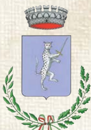
Comune di Gavardo